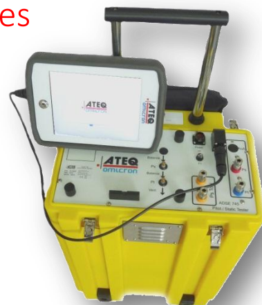
IHM simple et conviviale