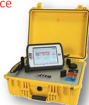
IHM simple et conviviale