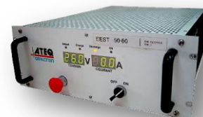
EEST 50-60 RACK