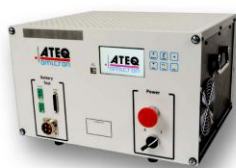
EEST 50-60 COMPACT (compatible MCMS12)